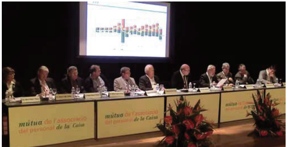
La Junta Directiva de la Mútua durant la passada assemblea anual.

El president va continuar la seva exposició explicant que l'objectiu de la Mútua per a l'exercici 2013 és el de continuar el Pla de Comunicació endegat, tant per captar nous mutualistes com per fidelitzar els actuals. També va explicar, la necessitat d'ampliar el Fons de Garantia per qüestions legals i la conseqüent transformació de la prestació d'Orfenesa en una pòlissa col·lectiva.