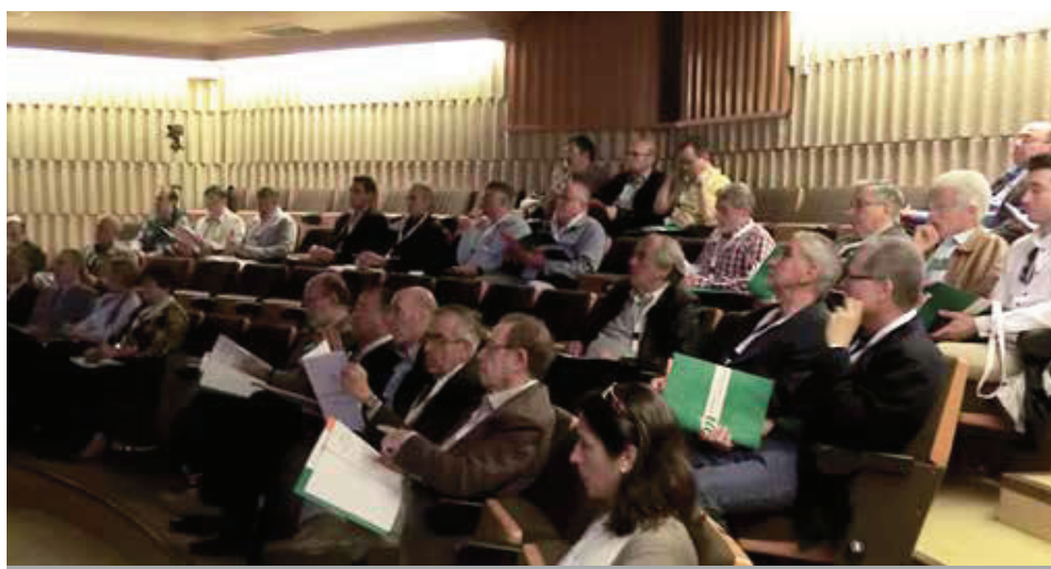
Mutualistes assistents a la reunió anual de la Mútua.

El president va cloure l'acte tot agraint la dedicació al personal de la Mútua, als membres de la Comissió de Control i al Responsable del Servei d'Atenció al Mutualista. ▮