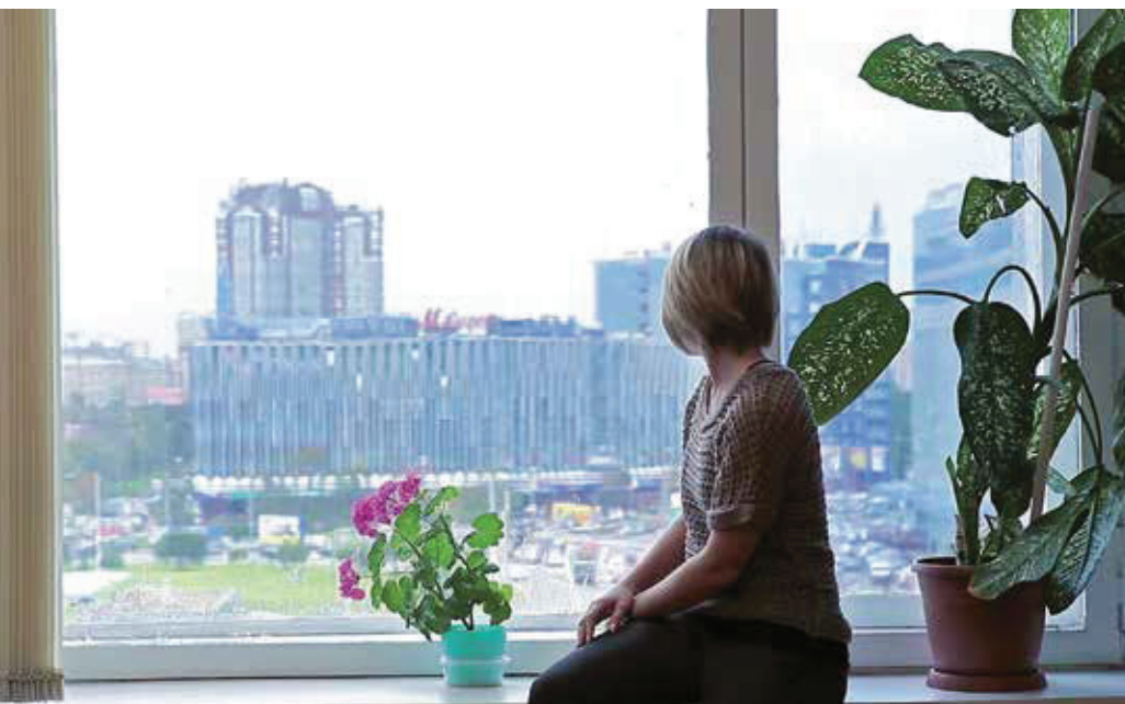
El limfoedema és un trastorn del sistema limfàtic.

És la seqüela més important del càncer de mama