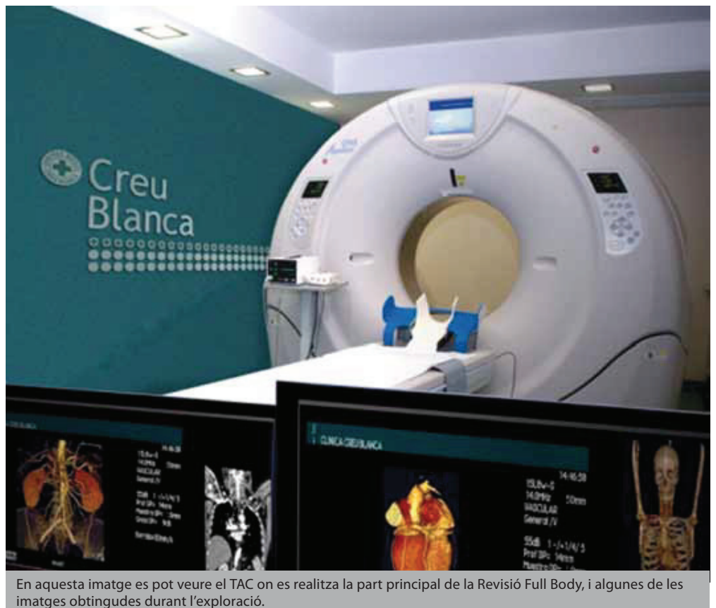
En aquesta imatge es pot veure el TAC on es realitza la part principal de la Revisió Full Body, i algunes de les imatges obtingudes durant l'exploració.

Malalties que abans eren considerades de gent gran com els infarts, els càncers, les embòlies, cada vegada més, afecten gent de mitjana edat i està comprovat que en aquest tipus de mal-