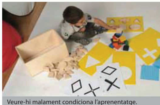
Veure-hi malament condiciona l'aprenentatge.

material de lectura es vegi clar i es mantingui nítid.