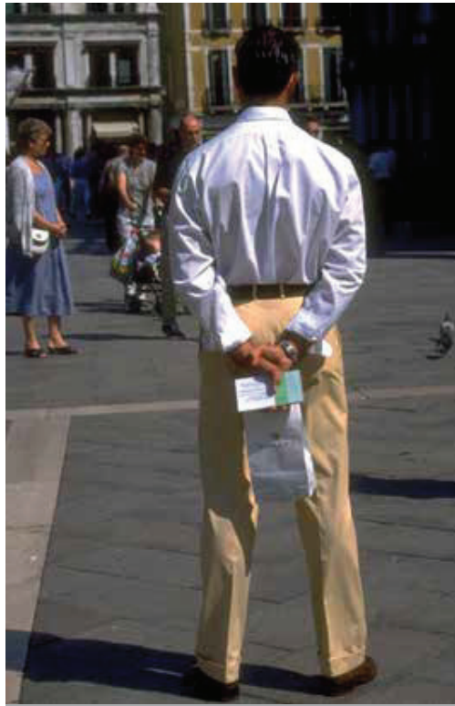
A partir dels 50 anys s'ha de visitar l'uròleg.

"Prefereixo que no parlem de curar perquè aquest tipus de càncer pot tornar a mostrar la seva cara deu o dotze anys després del seu tractament", apunta.